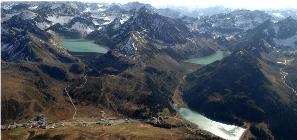
Die Alpenvereine aus Österreich, Deutschland und Südtirol treten ebenfalls eindringlich gegen die Erweiterungsvorhaben von Sellrain-Silz und im Kaunertal auf.